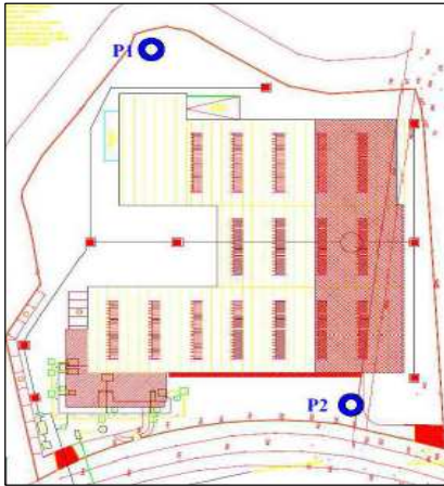
Ubicazione dei n. 2 piezometri per il controllo delle acque di falda