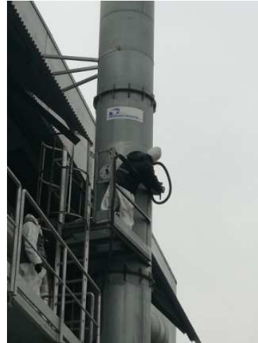
Monitoraggio punti di emissione