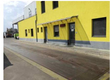
Area di accettazione carichi (pesa)